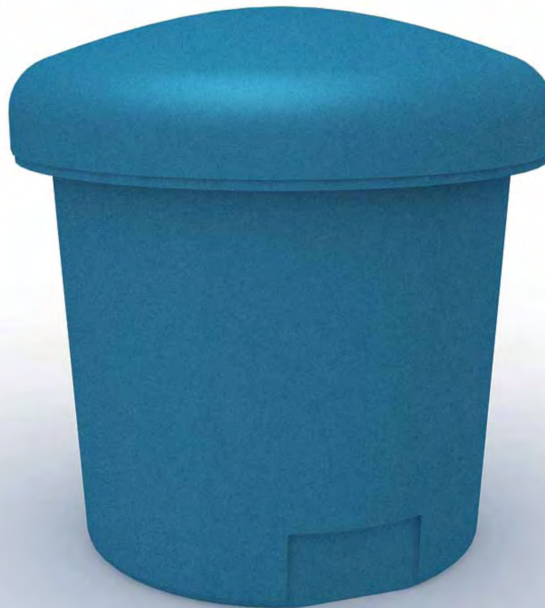
Tekniske specifikationer på GEOtop